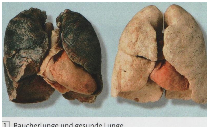
1 Raucherlunge und gesunde Lunge